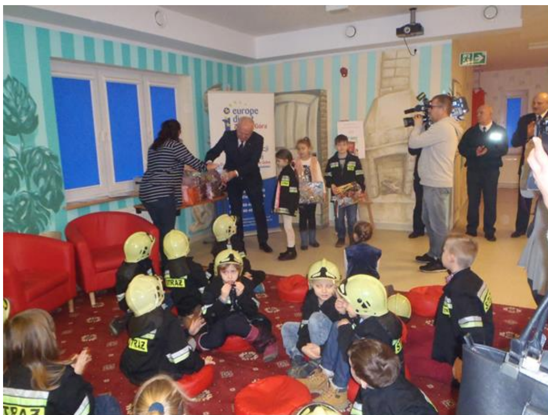
Uroczyste rozdanie nagród z rąk Wojewody Lubuskiego.